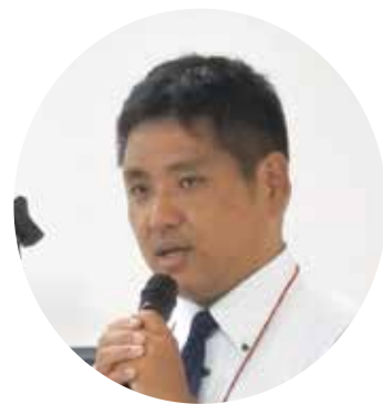
実行委員長 林道倫精神科神経科病院