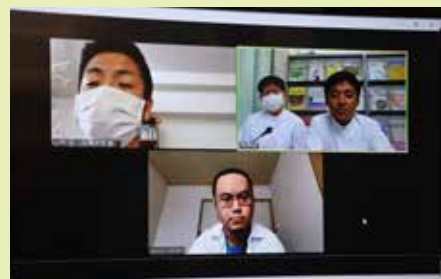
林病院の説明会の様子です